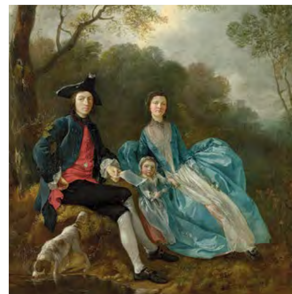
תומס גיינסבורו, משפחת גרבנור, 1754 (פרט) Thomas Gainsborough, The Gravenor Family, 1754 (detail)