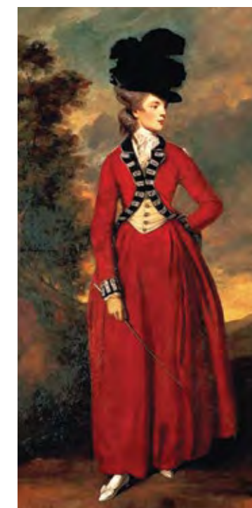
ג'ושוע ריינולדס, דיוקן הגברת וורסלי, 1776 (פרט) Joshua Reynolds, Portrait of Lady Worsley, 1776 (detail)