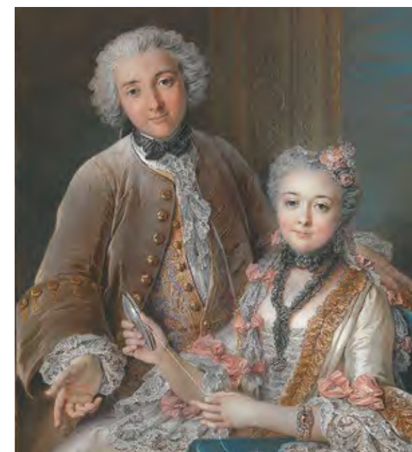
צייר-אנטוני קויפל, דיוקנם של פיליפ קויפל ואשתו, 1742 (פרט) Charles-Antoine Coypel, Portrait of Philip Coypel and his Wife, 1742 (detail)