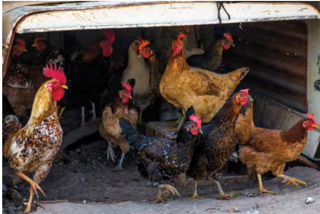
בחצר בורהאן, בקעת הירדן, 2017, צילום דיגיטלי, 30x45 In Burhan's Yard, Jordan Valley, 2017, digital photograph, 30x45