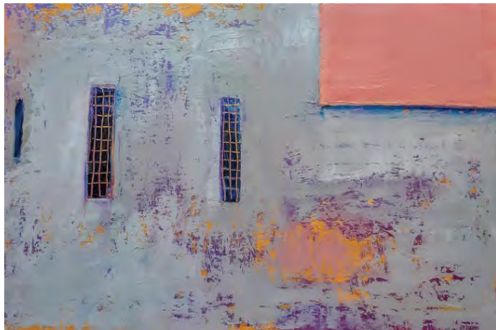
קיר ורוד, 2020, שמן על עץ, 40x60 Pink Wall, 2020, oil on wood, 40x60