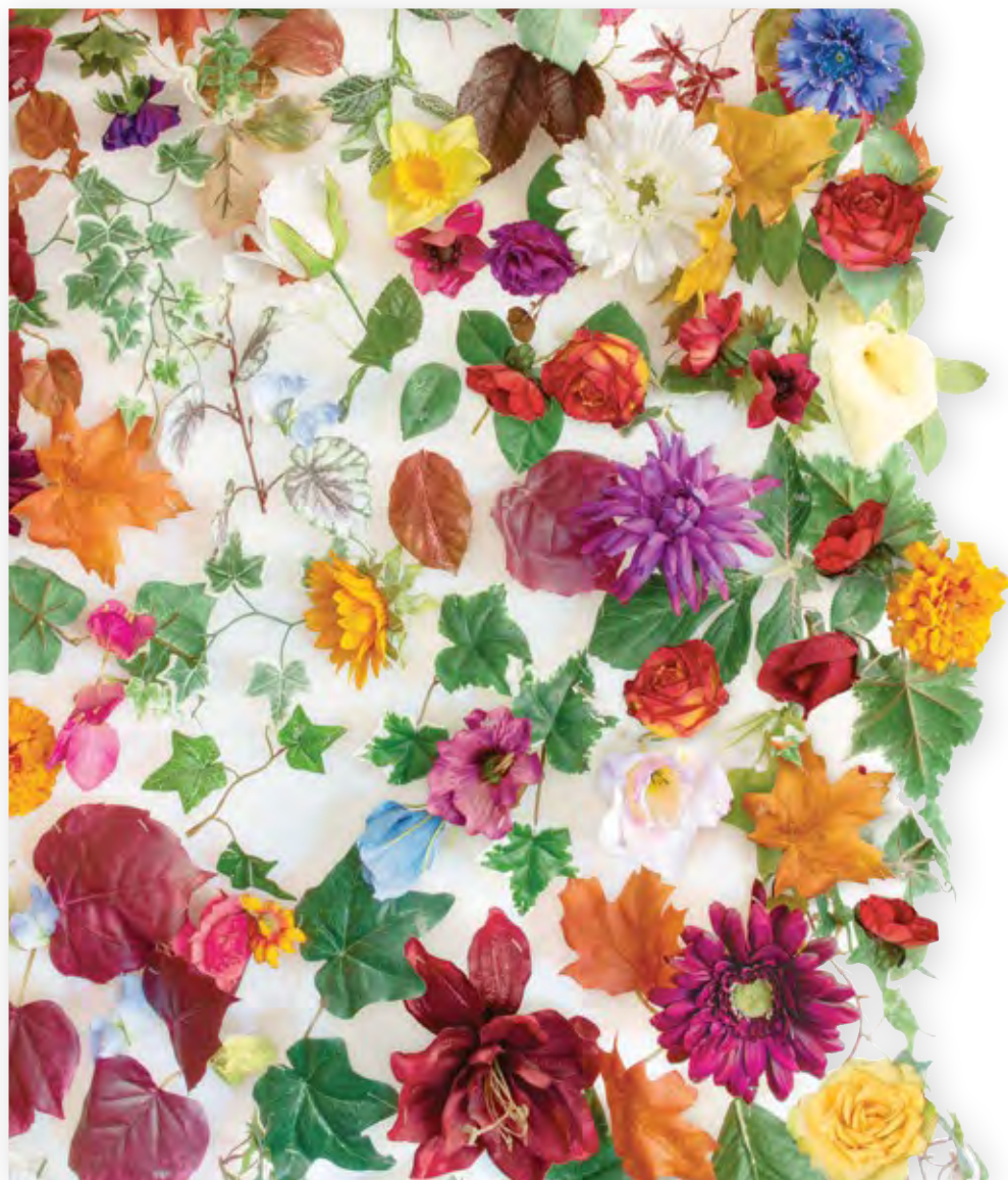
בן עדן, 2021, משי, פלסטיק, 120x60 (פרט) Garden of Eden, 2021, silk, plastic, 120x60 (detail)