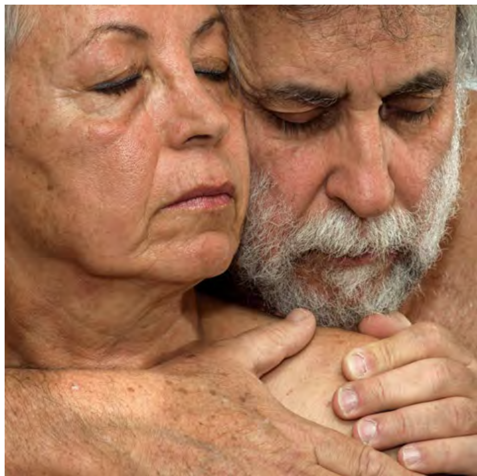
רומנס בשניים, 2018, צילום, הדפסת פיגמנט על נייר ארכיוני, 55x55 Twosome, Photograph, 2018, pigment print on archival paper, 55x55