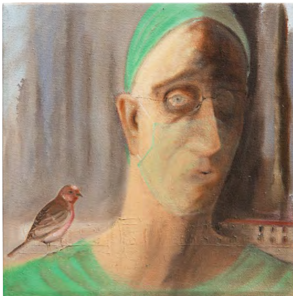
דיוקן עצמי עם ציפור ובית, מתוך הסדרה: טיפול לציפור 2015, שמן על בד, 30x30 Self Portrait with a Bird and Home, from the series: Treating a Bird, 2015, oil on canvas, 30x30