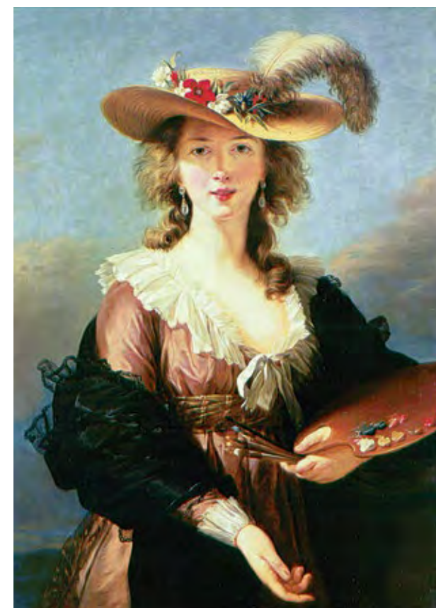
אליזבת-לואיז ויזיה-לה ברן, דיוקן עצמי, 1782 (פרט) Elisabeth-Louise Vigée-Lebrun, Self-portrait, 1782 (detail)