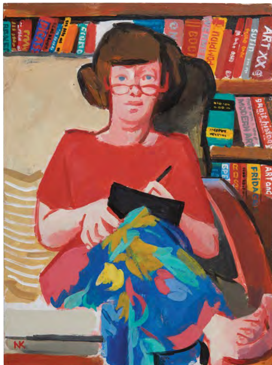
דיוקן עצמי, 2014, אקריליק על לוח mdf, 50x30 Self-Portrait, 2014, acrylic on mdf board, 50x30