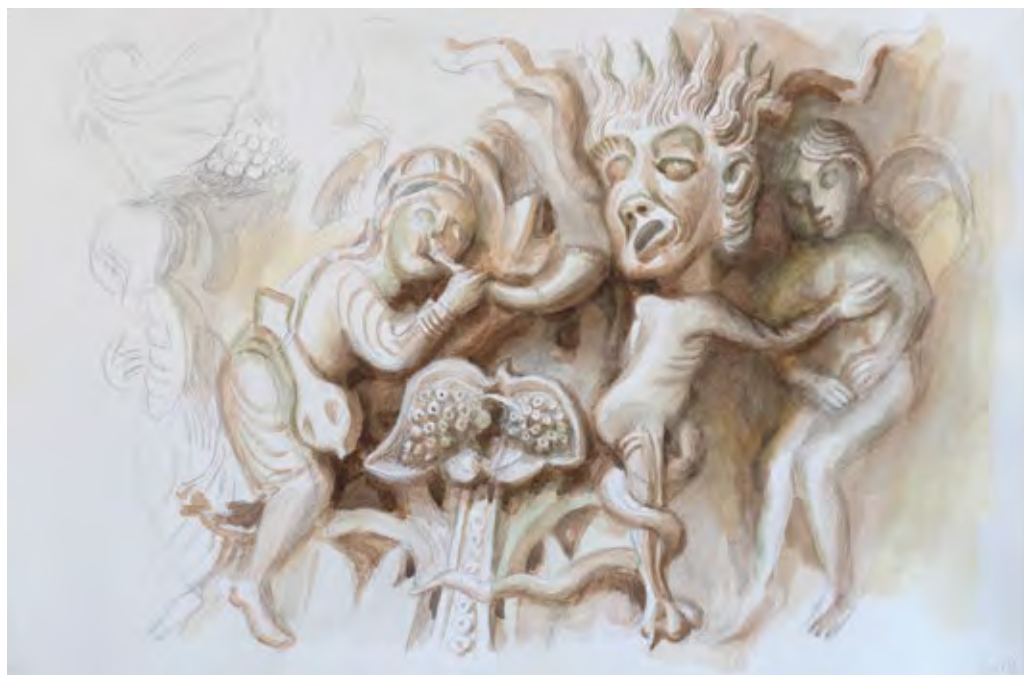
מוסיקה נלוזה, 2019, רישום אנליטי של תבליט רומנסקי, בזיליקת מארי-מדליין הקדושה, וזלה, צרפת, צבעי מים ועיפרון על נייר, 32x50 Profane Music, 2019, study of a Romanesque relief, Abbey of Sainte Marie Madeleine, Vézelay, France, watercolor and pencil on paper, 32x50