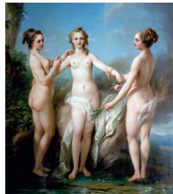
קארל ואן לו, שלושת הגרציות, 1765 (פרט) Carle van Loo, The Three Graces, 1765 (detail)