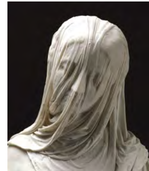
אנטוניו קורדיני, הגברת המצועפת, 1752 (פרט) Antonio Corradini, Veiled Lady, 1752 (detail)