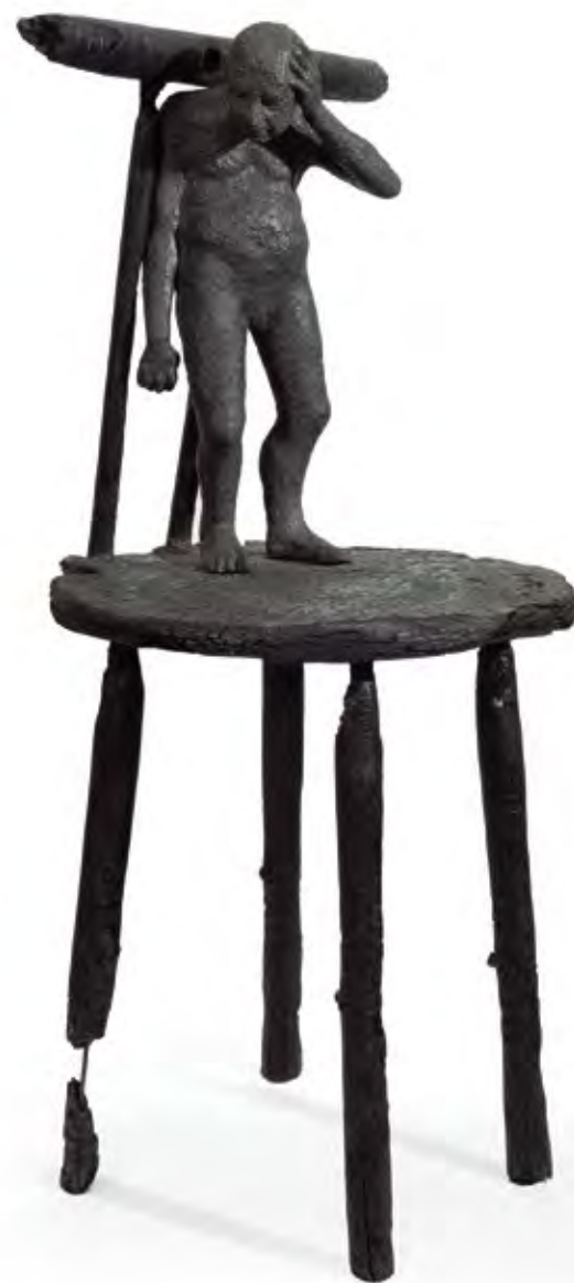
בונה עתיד מזהיר, 2012, פרט מתוך מיצב פחם, עץ שרוף, חימר שרוף, מוט ברזל, גרפיט, 87x38x38 Builder of a Bright Future, 2012, detail from Coal Installation, fired ceramic, steel bar, graphite, 87x38x38