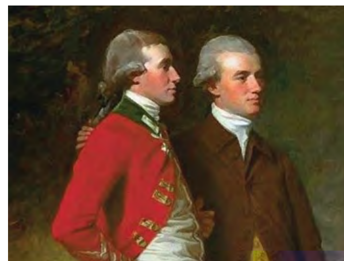
ג'ורג' רומני, משפחת ביאמונט, 1777 (פרט) George Romney, Beaumont Family, 1777 (detail)