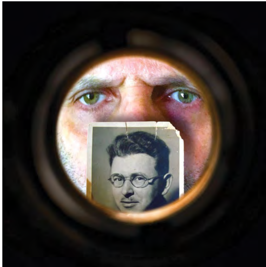
ללא כותרת, 2017, תצלום מעובד, 53x53 Untitled, 2017, processed photograph, 53x53