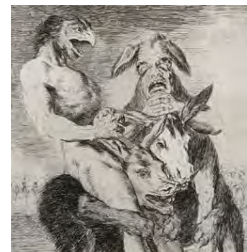
פרנסיסקו דה גויה, מתוך הסדרה קפריזות, 1799 (פרט) Francisco de Goya, from the series Los Caprichos (The caprices or whims), 1799 (detail)