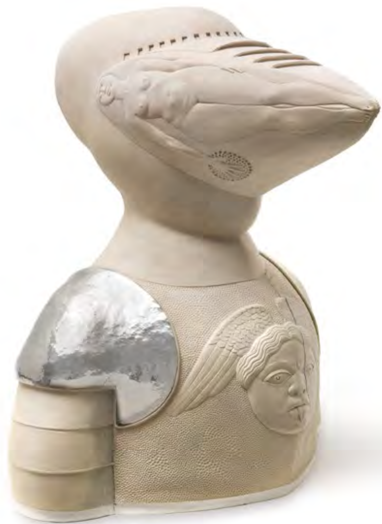
אינטרוברט, 2021, אדמית, בניית יד, שריפה גבוהה, 57x50x43 Introvert, 2021, earthenware, hand build, high temperature fired, 57x50x43