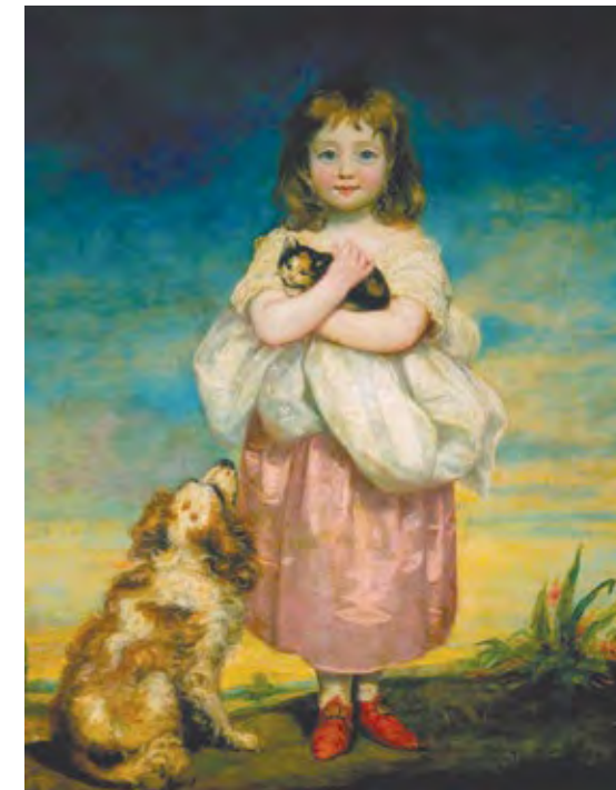
גיימס נורת'קוט, ילדה קטנה דואגת לחתול, 1795 James Northcote, A Little Girl Nursing a Kitten, 1795