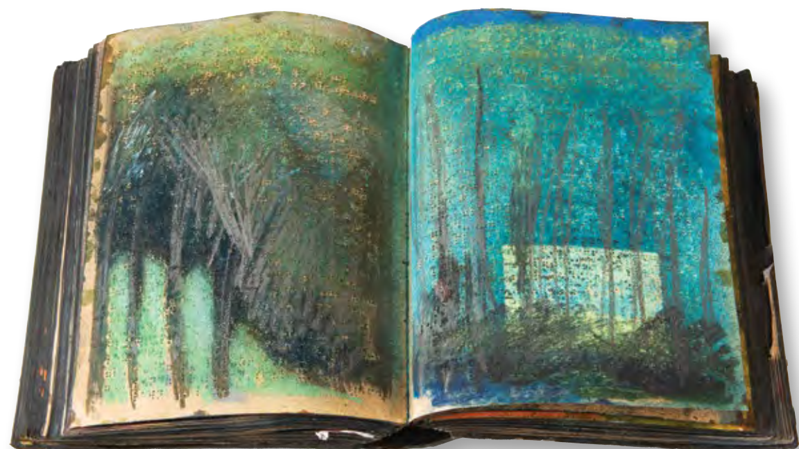
רואים את הקולות, 2017, צבעי מים על נייר ברייל, 35x60x8 See the Voices, 2017, watercolor on Braille paper, 35x60x8