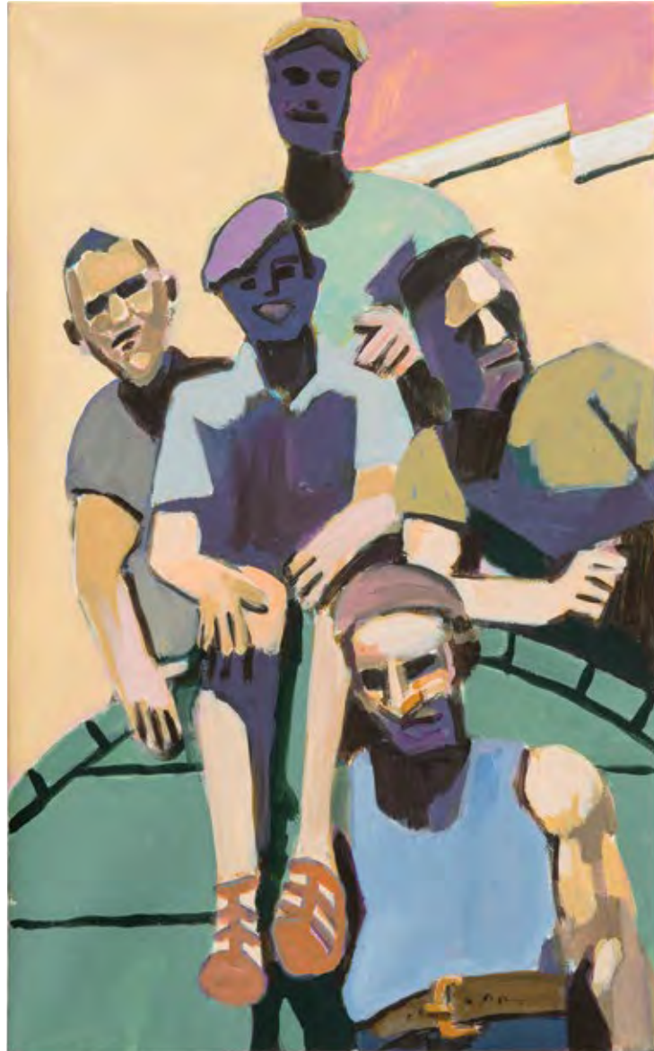
פועלים, 2021, אקריליק על בד, 80x50 Workers, 2021, acrylic on canvas, 80x50