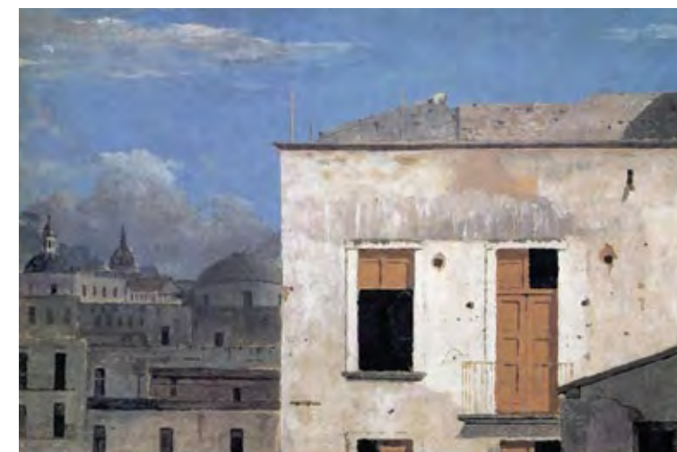
תומס ג'ונס, בניינים בנאפולי, 1782 Thomas Jones, Buildings in Naples, 1782