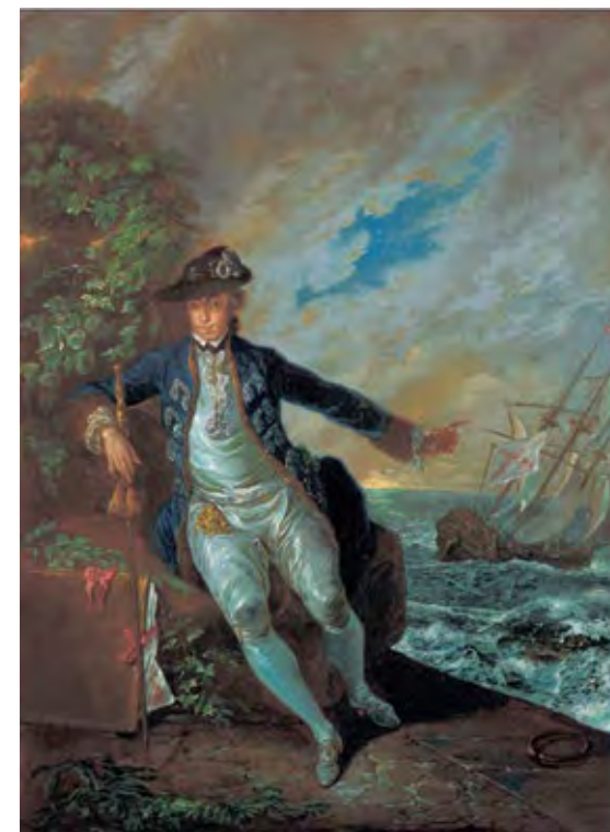
לואיס פארט אי אלקזר, דיוקן עצמי, 1779 Luis Paret y Alcazar, Self-portrait, 1779