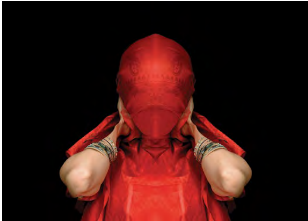
ללא כותרת, מתוך הסדרה מעשה-צעצועים, 2016, טכניקה מעורבת, 41x57 Untitled, from the series: Imagework, 2019, mixed technique, 41x57