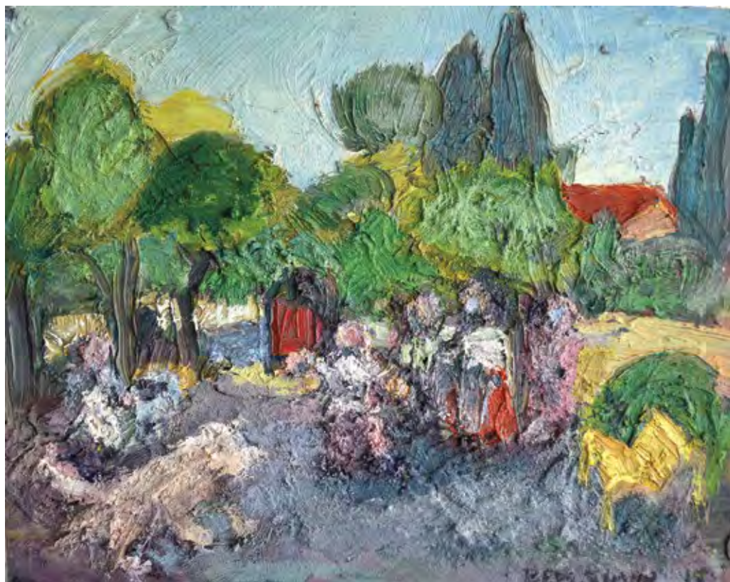
בן שמשועים עם כלב, 2016, שמן על לוח עץ, 31x39 Playground With a Dog, 2016, oil on panel, 31x39