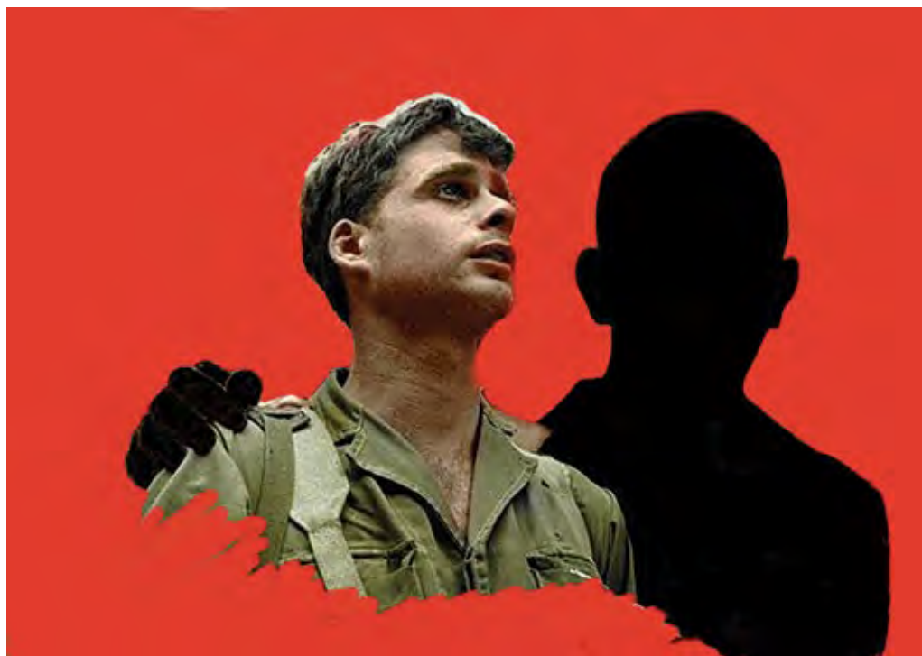
הוא ואני, מתוך הסדרה: צנחנים בכותל, 2017, הדפס דיגיטלי, 35x50 Him and Me, from the series: The Paratroopers by the Western Wall, 2017, digital print, 35x50