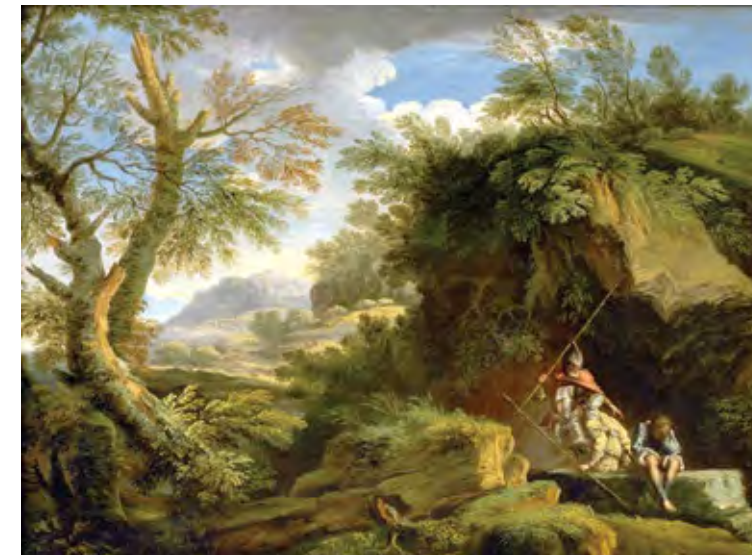
אנדראה לוקאטלי, נוף עם דמויות, המאה ה-18 Andrea Locatelli, Landscape with Figures, 18th Century