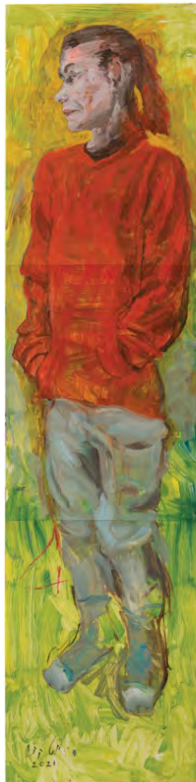
קסניה, 2021, שמן על נייר, 210x50 Ksenia, 2021, oil on paper, 210x50