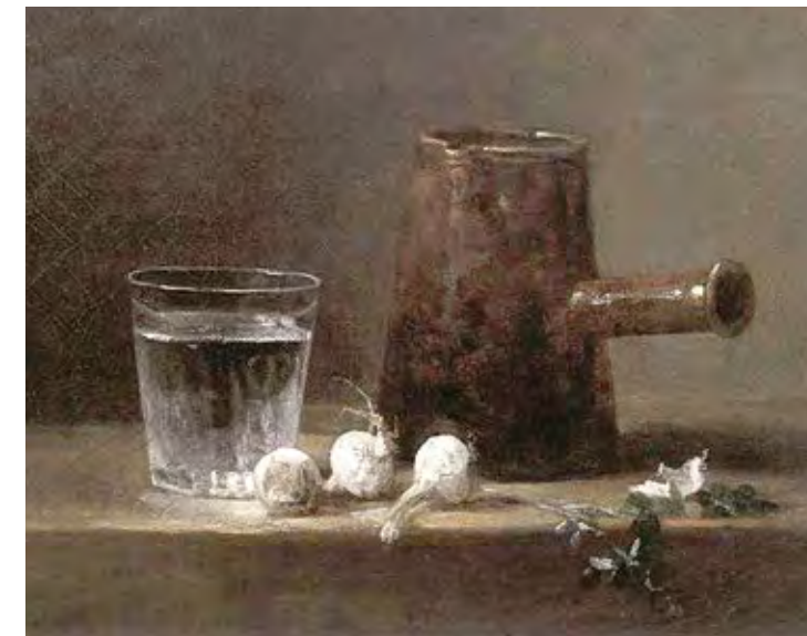
ז'אן-באטיסט-סימאון שרדן, כוס מים וקנקן קפה, 1761 (פרט) Jean-Baptist-Simeon Chardin, Glass of Water and Coffee Pot, 1761 (detail)