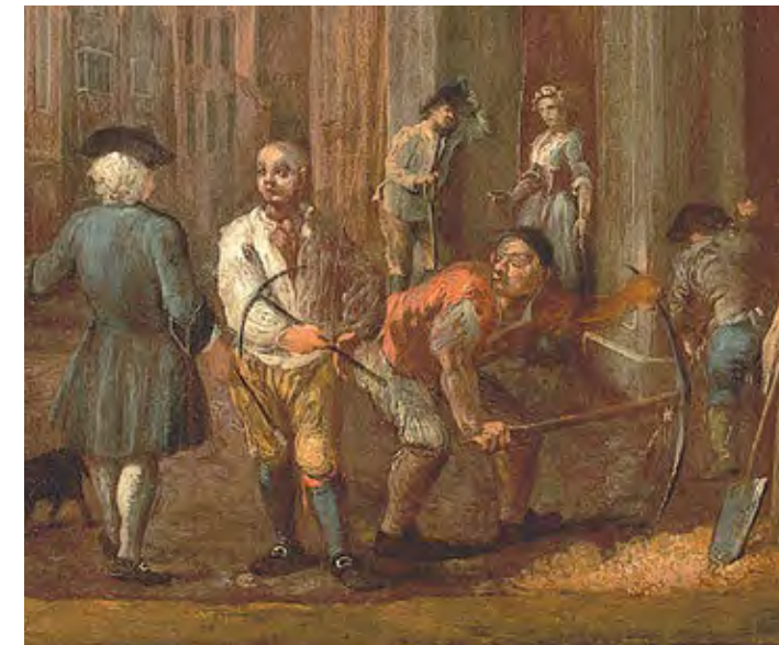
ויליאם הוגארת, חתימת חוזה על הבית, 1725 (פרט) William Hogarth, Sign for a Paviour, 1725 (detail)