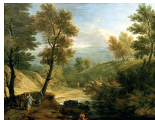
פרנץ יואכים ביץ', נוף עם שביל לאמאוס, 1720 Franz-Joachim Beich, Landscape with Path to Emmaus, 1720