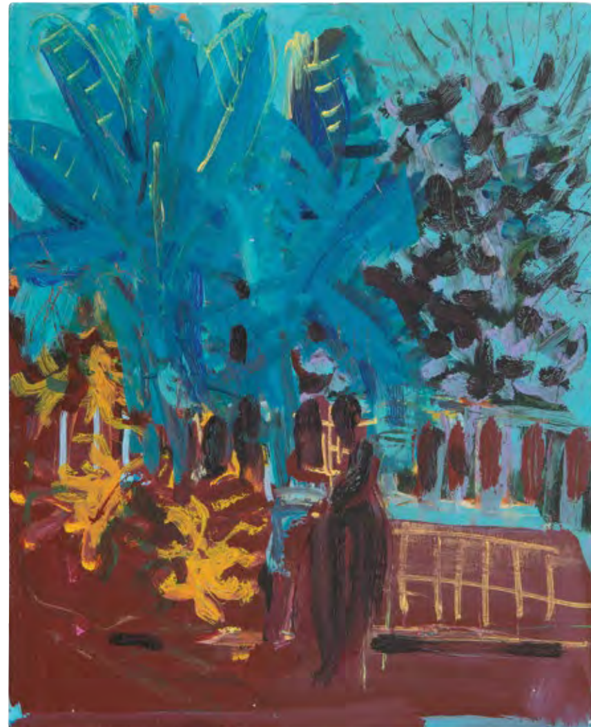
רחוב בוסתנים, 2020, טושים אקריליים על עץ, 24x19.5 Bustan Street, 2020, acrylic markers on board, 24x19.5