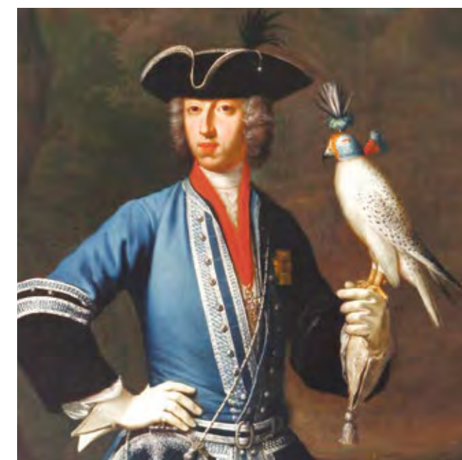
פטר ג'קוב הורמנס, דיוקן קלמנטס אוגוסט כצייד בזים, 1732 (פרט) Peter Jacob Horemans, Portrait of Clements August as Falconer, 1732 (detail)