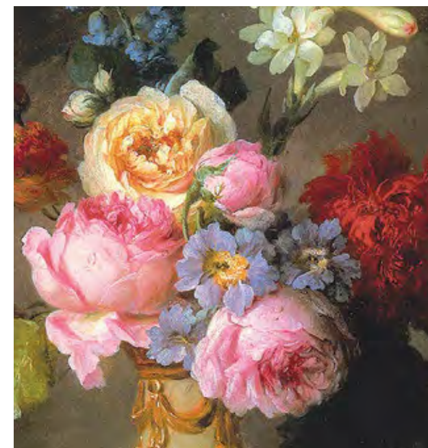
אן וולאיר-קוסטר, אגרטל עם פרחים, 1781 (פרט) Anne Vallayer-Coster, A Vase of Flowers, 1781 (detail)