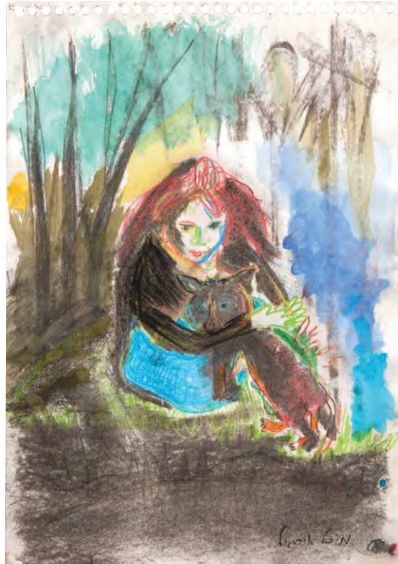
אהובי, 2021, פחם ופסטל על נייר, 29x21 Loved One, 2021, charcoal and pastel on paper, 29x21