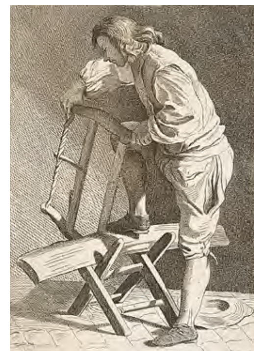
אמן לא ידוע, נגר, צרפת, המאה ה-18 Unknown Artist, A Wood Cutter, France, 18th century