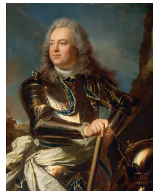
היאסינט ריגו, לואיס הנרי, 1720 (פרט) Hyacinthe Rigaud, Louis Henri, 1720 (detail)