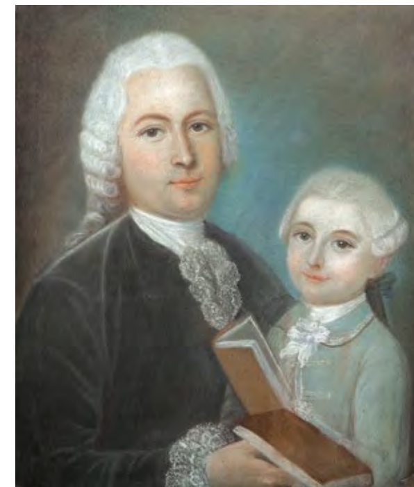
אמן לא ידוע, אסכולה צרפתית, אב ובן, המאה ה-18 Unknown Artist, Father and Son, 18th Century