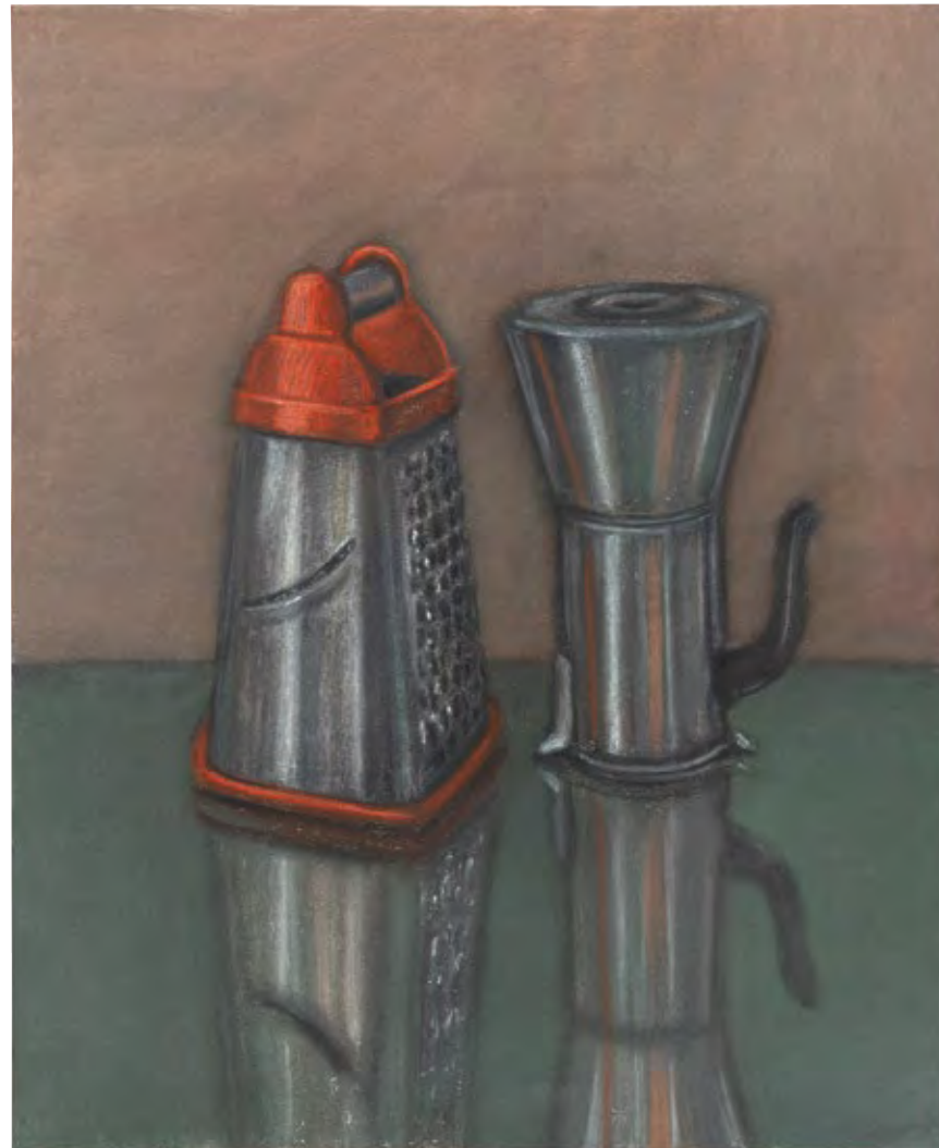
זוג מס' 5, 2021, פסטל יבש על נייר, 65x55 Couple #5, 2021, soft pastel on paper, 65x55